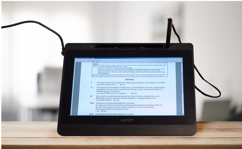
Signaturtablett mit angezeigtem Formular zur Unterschrift