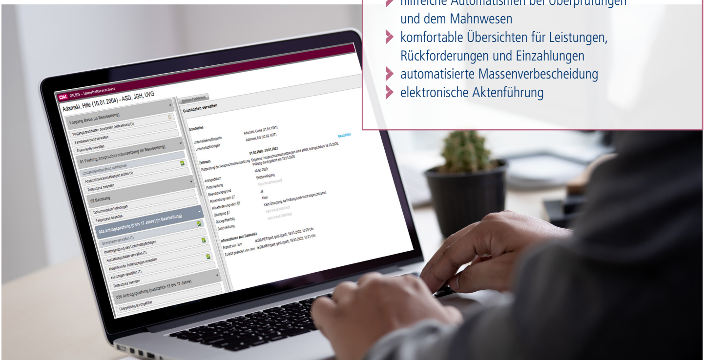
Klar strukturierter UVG-Prozess zur Antragsprüfung mit Grunddatenverwaltung