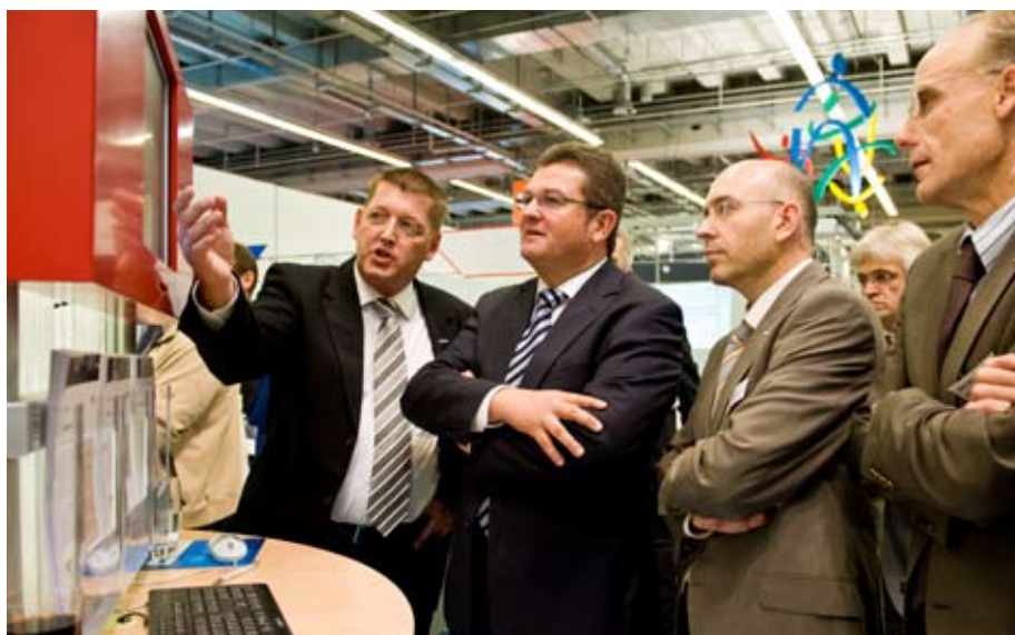
Staatssekretär Franz Josef Pschierer (2.v.l.) lässt sich auf dem Stand der AKDB Neuigkeiten aus dem Bereich Informations- und Kommunikationstechnik zeigen