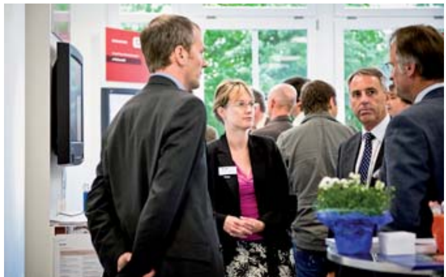
Interessierte Gäste auf der Hausmesse der Geschäftsstelle Unterfranken

+++ Kurzmeldungen: OK.EFA in Niedersachsen, AFÖGplus-Vollabschluss in Bayern +++