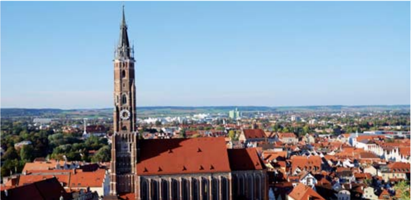
Schönes Landshut, moderne Verwaltung: OK.FIS macht das Haushalts-, Kassen- und Rechnungswesen noch effizienter

zufrieden und zuversichtlich: „Wir erwarten uns von der AKDB eine höchstmögliche Integration von Daten auch anderer Fachverfahren in OK.FIS.“ Die Stadt Landshut nutzt bereits die Vorteile zahlreicher AKDB-Verfahren. Deren Integration untereinander ist eine der Kernkompetenzen der AKDB. Dies garantiert Datensicherheit und sorgt für Zeitersparnis, wovon wiederum die Verwaltung und die Bürger Landshuts profitieren.