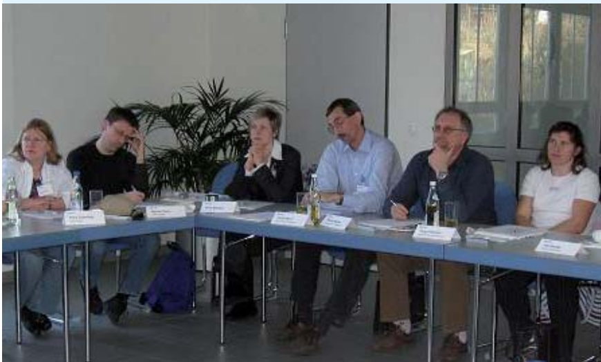
Erfolgreiche AKDB-Kundenfachtagungen für die Sozialen Dienste: Die Vertreter der Jugendämter zeigten sich mit OK.KIWO und OK.JUG sehr zufrieden!

Alle Anträge gehen am Arbeitsplatz des Sachbearbeiters direkt in den Posteingangskorb von OK.EWO ein. Damit tritt in der Verwaltung eine spürbare Arbeitserleichterung ein.